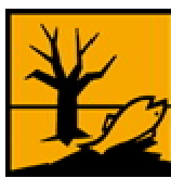
N - Dangereux pour l'environnement