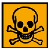
T+ - Très toxique